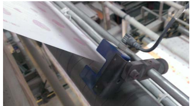
Ultrasonik Sensör DU-1 yüksek tozlu alanlar içerisinde kullanılmaktadır.