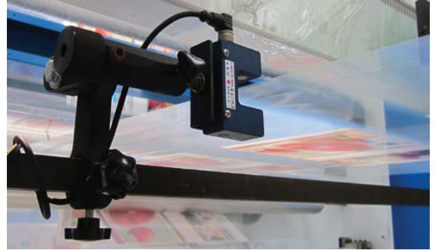
Ultrasonik Sensör DU-1 baskı makinesi üzerinde kullanılmaktadır.